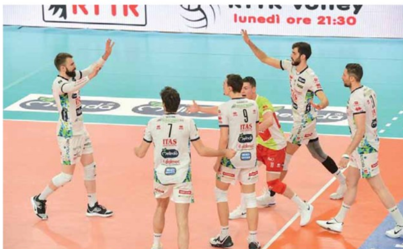
• La gioia dei giocatori dell'Itas: con Monza non è stata una passeggiata