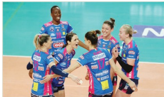
Le ragazze di Novara esultano dopo un successo