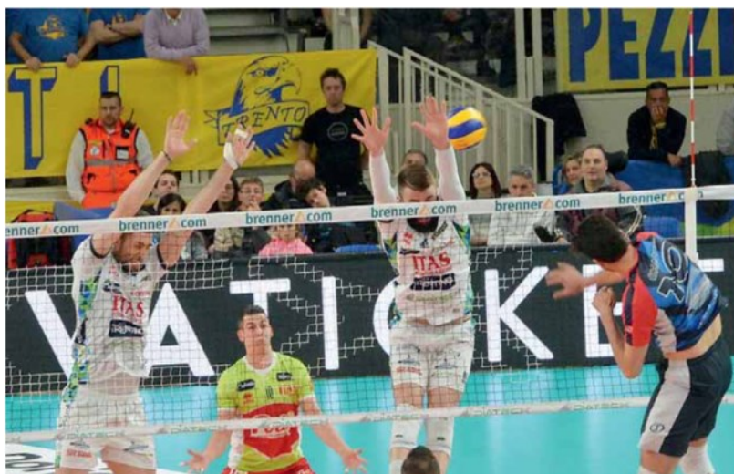
• Con il muro Itas non si passa